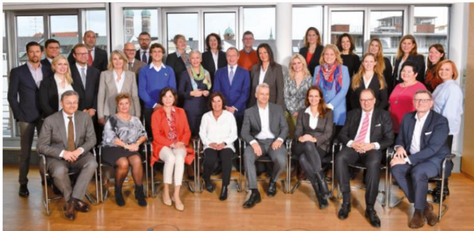
Unser Team (v.l.n.r.)

Wollen Sie ihrem Mieter, der durch die Krise in Not geraten ist, helfen, diese schwierige Zeit zu überbrücken und ihm die Miete stunden oder vielleicht zum Teil sogar erlassen? Dann sollten Sie dies auch richtig formulieren! Dazu finden Sie entsprechende Muster auf unserer Internetseite unter: https://www.haus-und-grund-muenchen.de/presse-neuigkeiten/e/musterbrief-corona-verlangerung-raumungsfrist https://www.haus-und-grund-muenchen.de/presse-neuigkeiten/e/musterbrief---corona-stundung