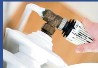
Schuld ist unter anderem die Pandemie: Kochen, heizen, daheim arbeiten – wegen des Lockdowns steigen die Nebenkosten