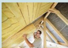
Bis 2030 müssen Gebäude besser gedämmt werden.

Das EU-Parlament segnete die Pläne im Grundsatz am 14. März 2023 in erster Lesung ab. Der Beschluss des EU-Parlaments ist nicht